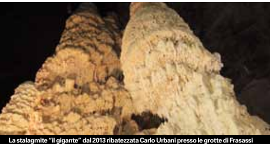
La stalagmite “il gigante” dal 2013 ribattezzata Carlo Urbani presso le grotte di Frasassi

OMAGGIO DEDICATO A CARLO URBANI E PREMIAZIONI